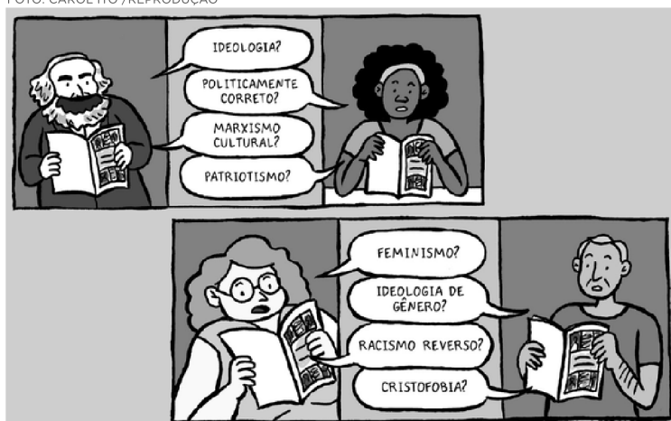
ILUSTRAÇÃO DA CAPA DO LIVRO TERMOS AMBÍGUOS DO DEBATE POLÍTICO ATUAL

Termos como “cidadão de bem”, “identitarismo”, “patriotismo” e “cristofobia” são expressões que se tornaram corriqueiras no debate político atual. Outras palavras que parecem ter definição sólida, como “família”, ganharam outras leituras.