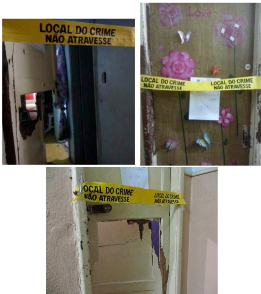
Figura 9: Portas quebradas pela polícia no dia da invasão. Prostitutas disseram que, em alguns casos, a polícia pediu para elas fecharem as portas, que foram em seguida derrubadas por eles.

www.observatoriodaprostituicao.wordpress.com LeMetro-Laboratório de Etnografia Metropolitana Instituto de Filosofia e Ciências Sociais Universidade Federal do Rio de Janeiro Largo de São Francisco de Paula, nº 01, Sala 417, Centro, Rio de Janeiro, Cep: 20.051-071 - RJ Brasil (00-55-21) 2221-7539 (00-55-21) 2622-3856 Email: observatoriodaprostituicao@gmail.com