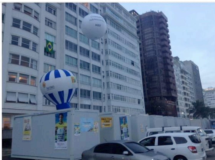
Figura 13: Posto avançado do Conselho Tutelar em Copacabana, com cartazes pregando a denúncia da exploração sexual de crianças e adolescentes. O Balcony Bar e a Praça do Lido ficam um pouco além das palmeiras, na margem direita da foto.

A percepção de Lana ecoa o que disseram muitas outras trabalhadoras de sexo, em outros pontos da cidade. Seus depoimentos informam que os direitos das pessoas, especialmente, de profissionais do sexo, em termos de acesso de informação e meios de promoção da saúde sexual foram desrespeitados.