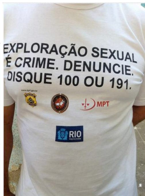
Figura 14: Camiseta de funcionário do Posto Avançado. Nenhum caso de exploração sexual de crianças ou adolescentes, relacionado à Copa do Mundo, foi denunciado ao Conselho Tutelar.

www.observatoriodaprostituicao.wordpress.com LeMetro-Laboratório de Etnografia Metropolitana Instituto de Filosofia e Ciências Sociais Universidade Federal do Rio de Janeiro Largo de São Francisco de Paula, nº 01, Sala 417, Centro, Rio de Janeiro, Cep: 20.051-071 - RJ Brasil (00-55-21) 2221-7539 (00-55-21) 2622-3856 Email: observatoriodaprostituicao@gmail.com