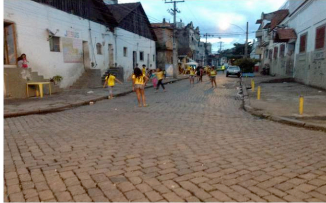
Figura 1: Dois times de meninas (várias das quais filhas de trabalhadoras sexuais) jogam futebol nas ruas próximas da Vila Mimosa, 9/7/2014