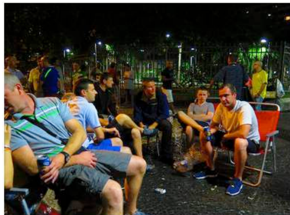
Figura 7: A Praça do Lido, cheia de turistas, trabalhadoras sexuais, moradores de rua e comerciantes itinerantes, em frente ao Balcony, fechado pela polícia no primeiro dia da Copa do Mundo.