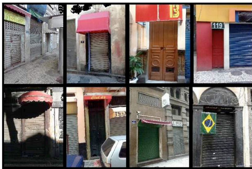
Figura 3: Oito das dezenas de casas de prostituição do Centro do Rio que fecharam em dias de jogo por falta de clientes.

Finalmente mas não menos importante, no caso específico do Rio de Janeiro, a pesquisa revela que não houve nenhum investimento das instituições governamentais da saúde pública no sentido da promoção da saúde sexual, especialmente no que diz respeito à prevenção das DST/HIV/AIDS nos contextos de prostituição observados. Essa lacuna contrasta fragorosamente com as medidas de política pública implementadas no passado por ocasião de grandes eventos.