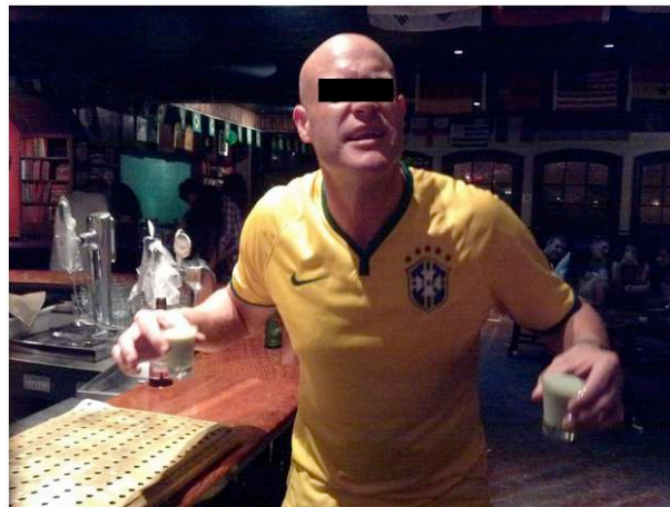
Figura 6: Turista estrangeiro bebendo em bar de Ipanema.

De maneira geral, o bar estava sempre à beira uma explosão, por efeito da bebedeira e agressividade da clientela. Aí era possível, de fato, identificar quase todos os comportamentos masculinos ou “machistas”, geralmente associados aos megaeventos esportivos, mas não encontramos aí nenhuma prostituta. Esse clima pesado contrastava com o que vimos na Vila Mimosa – um lugar percebido como barra pesada - onde o comportamento público dos homens era, em geral (fora uma ou outra exceção) calmo e respeitoso.