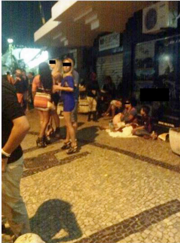
Figura 10: Garotas de programa trabalhando ao lado de uma família de moradores de rua, próximo do fechado Balcony, Praça do Lido, Copacabana, 4/7/2014.