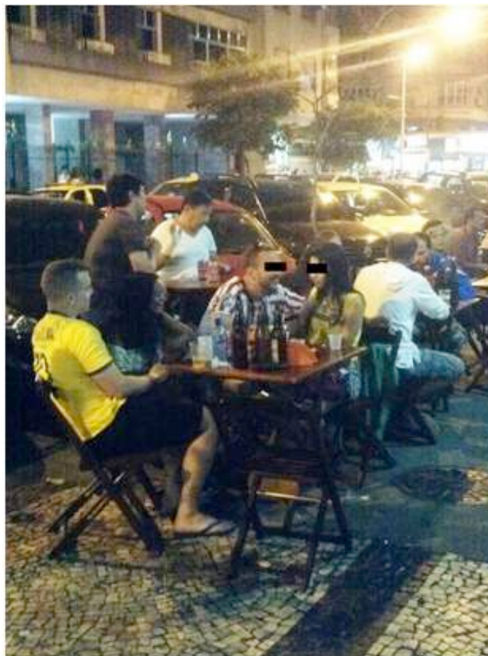
Figura 12: Foto que ilustra bem as dificuldades inerentes às tentativas de adivinhar a idade e situação de mulheres através do olhar, sem nenhuma outra informação. A moça na mesa, conversando com um turista estrangeiro, tem, de fato, 20 anos de idade e afirma não ser trabalhadora sexual, mas foi apontada por vários interlocutores nossos como “prostituta adolescente”.

www.observatoriodaprostituicao.wordpress.com LeMetro-Laboratório de Etnografia Metropolitana Instituto de Filosofia e Ciências Sociais Universidade Federal do Rio de Janeiro Largo de São Francisco de Paula, nº 01, Sala 417, Centro, Rio de Janeiro, Cep: 20.051-071 - RJ Brasil (00-55-21) 2221-7539 (00-55-21) 2622-3856 Email: observatoriodaprostituicao@gmail.com